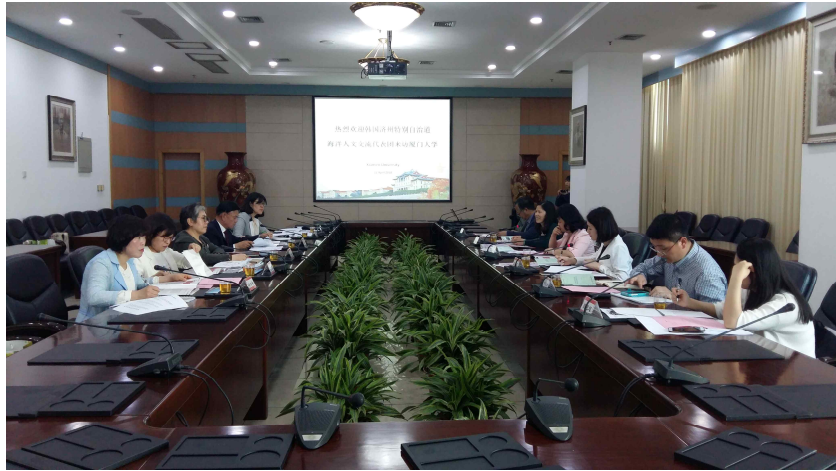
사진1: 제주여성가족연구원-샤먼대여성/젠더연구교육기지 여성해양인문교류 회의