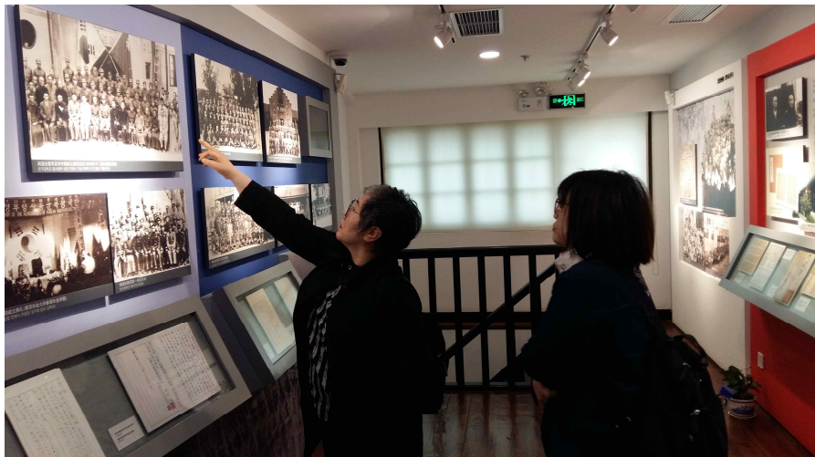
사진2: 대한민국임시정부 설립과정 사진 관람