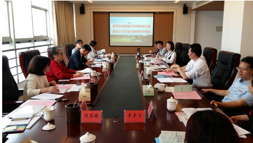
사진1: 제주여성가족연구원-푸텐대학 마조문화연구원 여성해양인문교류 회의