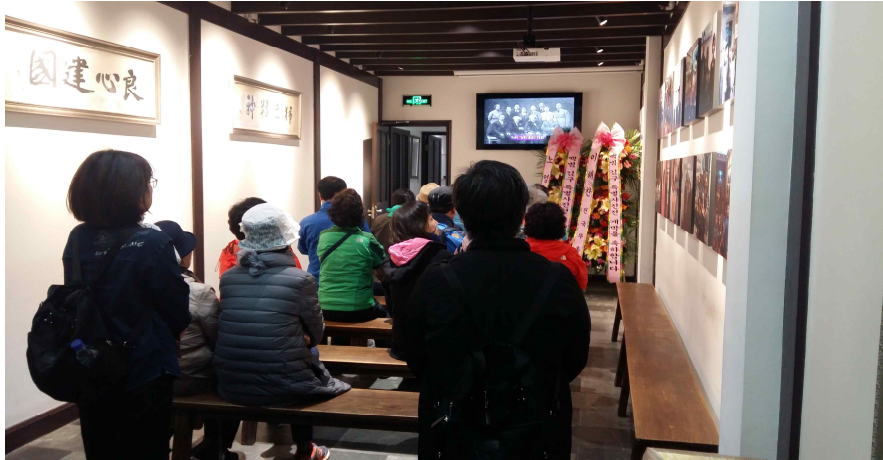
사진1: 대한민국임시정부 설립과정 동영상 시청