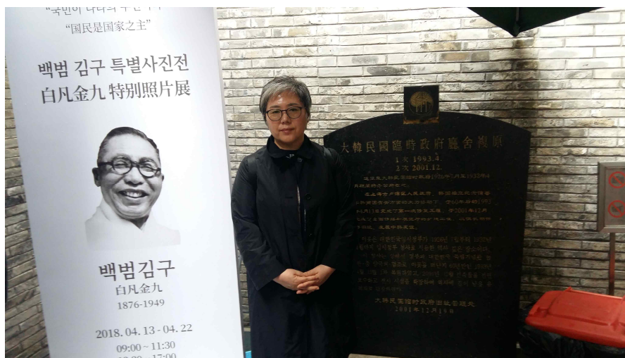
사진3: 대한민국임시정부 유적지에서 백범 김구 특별사진전 관람