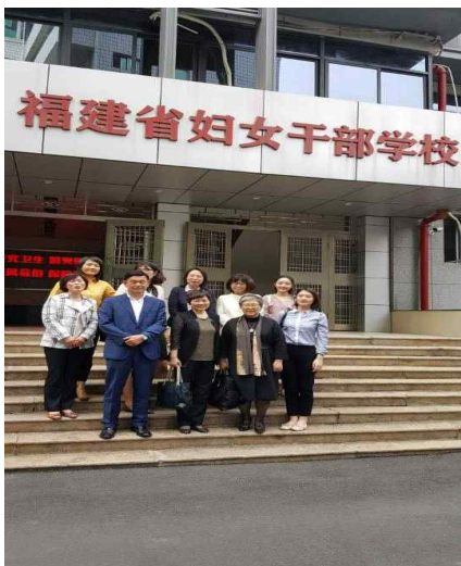
사진3: 제주여성가족연구원-푸젠성부녀연합회 여성해양인문교류 회의 참석자 일동