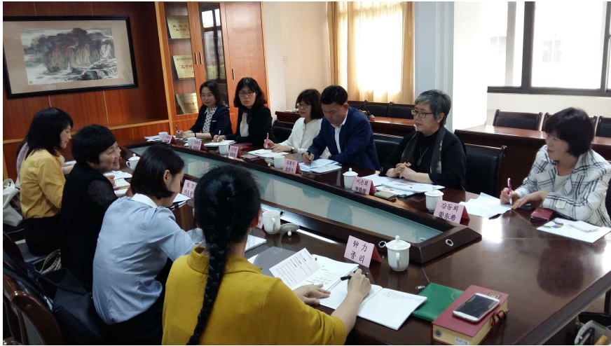
사진1: 제주여성가족연구원-푸젠성 부녀연합회 여성해양인문교류 회의